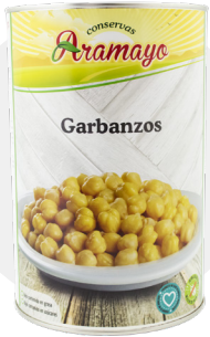
Formato | 4250 Pesos | P.N: 4000g- P.E: 2655g