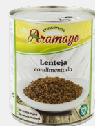
Formato | 850 Pesos | P.N: 780g- P.E: 530g

* Disponible en formato sin sal añadida.