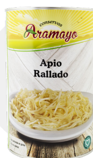
Formato | 4250