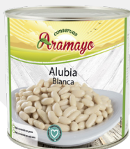
Formato | 2650 Pesos | P.N: 2500g- P.E: 1600g