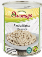
Formato | 850 Pesos | P.N: 780g- P.E: 500g