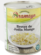
Formato | 850