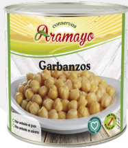
Formato | 2650 Pesos | P.N: 2500g- P.E: 1600g