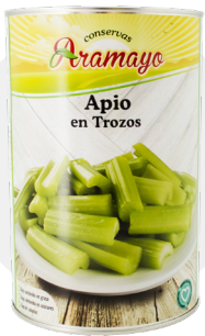
Formato | 4250 * Pesos | P.N: 4000g- P.E: 2505g