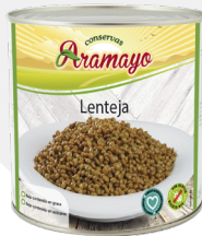
Formato | 2650 Pesos | P.N: 2500g- P.E: 1600g