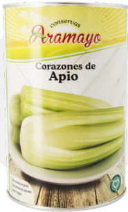
Formato | 4250 * Pesos | P.N: 4000g- P.E: 2655g