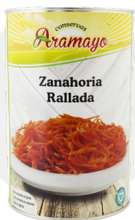
Formato | 4250