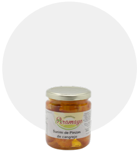
Pinzas de cangrejo

Formato | 250 Pesos | P.N: 220g- P.E: 125g