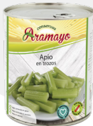
Formato | 850 * Pesos | P.N: 780g- P.E: 500g