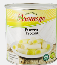
Formato | 2650 * Pesos | .N: 2500g- P.E: 1505g

* Disponible en formato sin sal añadida.