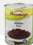
Formato | 850 Pesos | P.N: 780g- P.E: 500g