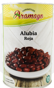
Formato | 4250 Pesos | P.N: 4000g- P.E: 2505g