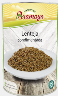
Formato | 4250 Pesos | P.N: 4000g- P.E: 2655g