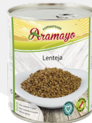
Formato | 850 Pesos | P.N: 780g- P.E: 530g