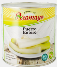
Formato | 2650 * Pesos | P.N: 2500g- P.E:1560g