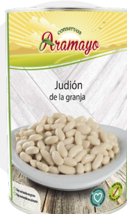
Formato | 4250 Pesos | P.N: 4000g- P.E: 2295g