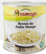
Formato | 2650