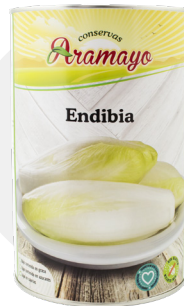
Formato | 4250 * Pesos | P.N: 4000g- P.E: 2655g