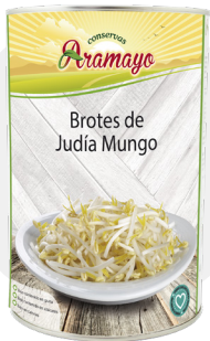
Formato | 4250