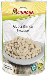
Formato | 4250 Pesos | P.N: 4000g- P.E: 2505g