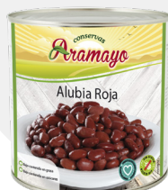
Formato | 2650 Pesos | P.N: 2500g- P.E: 1600g