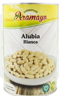
Formato | 4250 Pesos | P.N: 4000g- P.E: 2505g