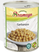
Formato | 850 Pesos | P.N: 780g- P.E: 530g