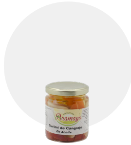
Cangrejo en aceite

Formato | 250 Pesos | P.N: 220g- P.E: 125g