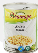
Formato | 850 Pesos | P.N: 780g- P.E: 500g