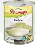
Formato | 850 * Pesos | P.N: 780g- P.E: 530g