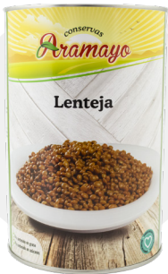
Formato | 4250 Pesos | P.N: 4000g- P.E: 2655g