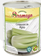
Formato | 850 * Pesos | P.N: 780g- P.E: 530g