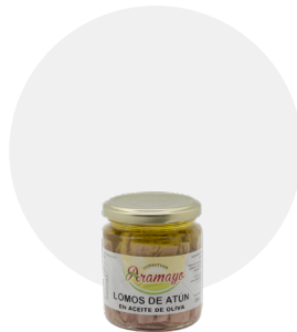
En aceite de oliva

Formato | 250 Pesos | P.N: 220g- P.E: 150g