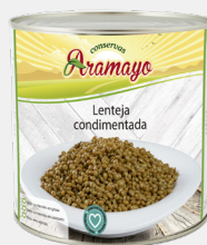
Formato | 2650 Pesos | P.N: 2500g- P.E: 1600g